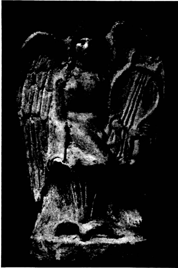
Abb. 5. Terrakotte, Berlin.

Und Eros selbst – des Warnrufs des Alkman nicht achtend – hat sich auf den Ranken, die sich dünn und fein zu den Seiten der Henkelpalmetten zu Spiralen drehen, niedergelassen, um dem wunderbaren Geschehen auf dem Erichthonios-