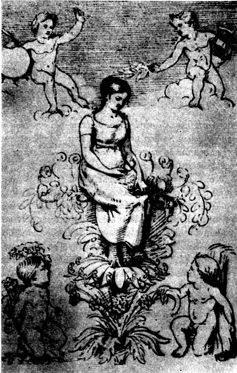
Abb. 8. Ph. O. Runge, «Natur».

Nur dem, der wie Eros unbeschwert und vogelleicht ist, bieten Blüten und zarte Ranken sicheren Halt. Er schwebt im Sonnenschein über die von Blumen duftende Wiese und treibt im Schatten lauschiger Adonisgärtchen sein Wesen.