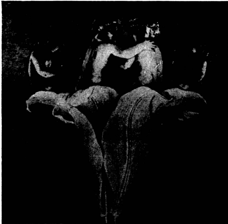
Abb. 6. Ph. O. Runge, Vorarbeit zum «Morgen».

Jedenfalls fühlt er sich sicher im Dickicht des Ornamentes, das ihn trägt – man sieht es, wenn man es auch nicht glaubt. Und was hier Hermonax, der Maler des Gefäßes, in klassischer Gestalt zeigt, lebt weiter und wuchert weiter. Immer