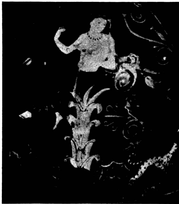
Abb. 7. Apulische Hydria, Neapel.

Doch, was dem Racker Eros, dem vogelleichten, ansteht, schickt sich nicht für jeden. Wenn Io, den Schleier lüftend, sich zur Rast auf einer Staude im Dickicht